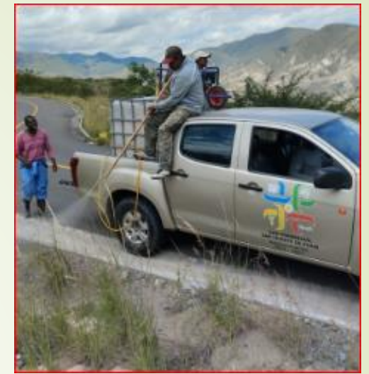
Aplicación de herbicida (rondo) en vías y calles