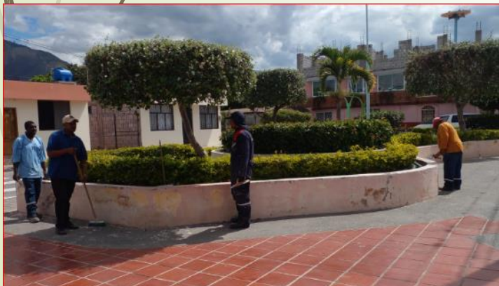
Mantenimiento de parques