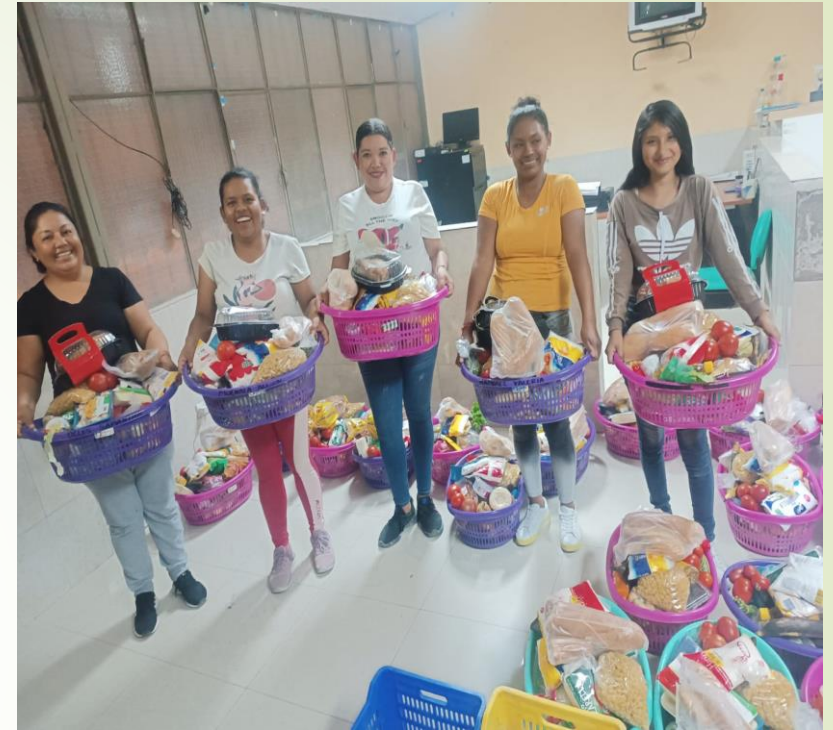
Entrega de kits alimenticios donados por el Banco de Alimentos de Imbabura

A familias de escasos recursos se donó materiales de construcción, ataúdes, tratamientos y recetas medicas, viveres entre otras ayudas.