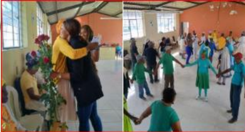
Festejo de días especiales