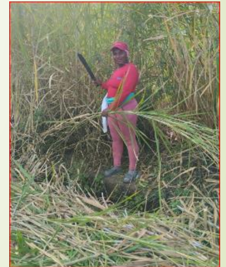
Apoyo de vocales en limpieza