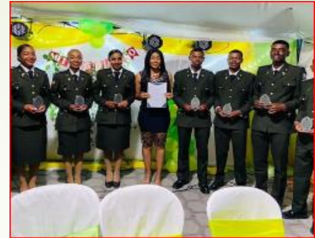
Reconocimiento a policías recién graduados