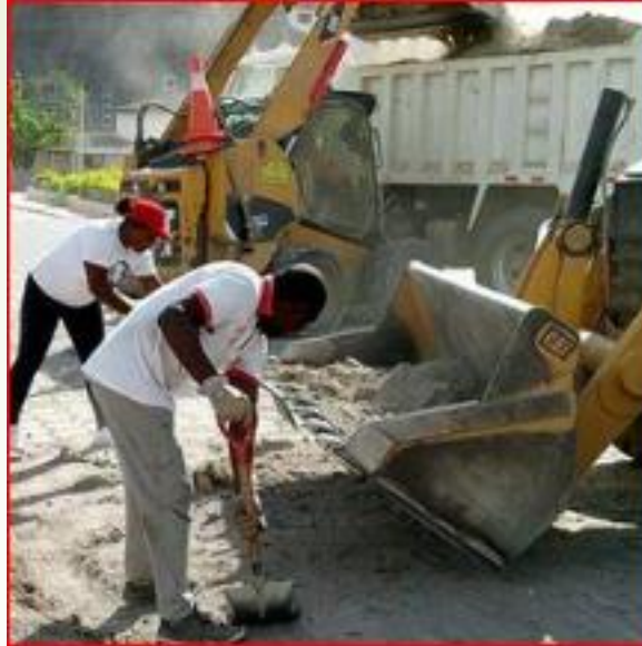
Contratación de un jornalero Inversión total: 5.386,42 dólares Financiamiento: Municipio de Bolívar y GAD parroquial con un valor de 3.852,73 dólares