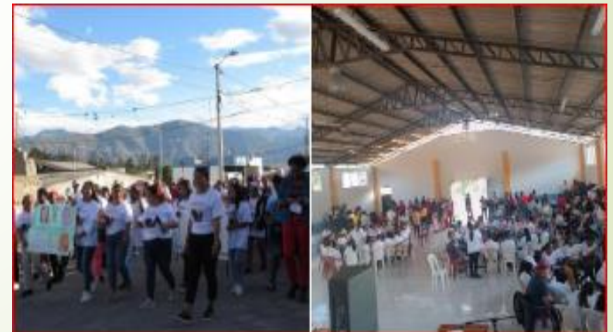
Difusión de los derechos de las mujeres