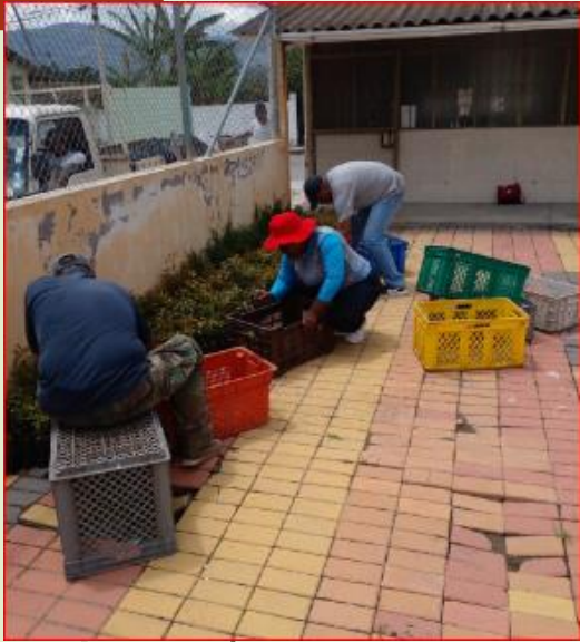
Se sembró de 3000 plantas